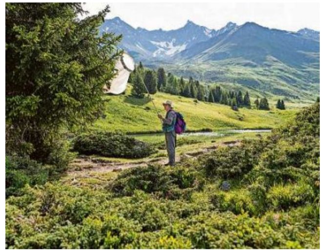
Egn digls maletgs premias dall'Alp Flex da Gaëtan Bally.